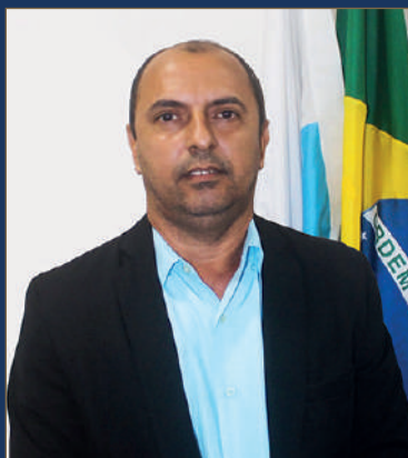
MAGÚ DOS BRINQUEDOS 2º VICE-PRESIDENTE AVANTE