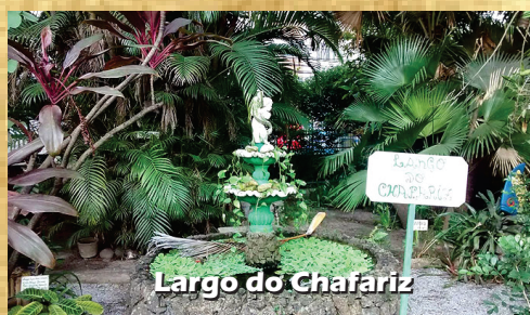
Largo do Chafariz