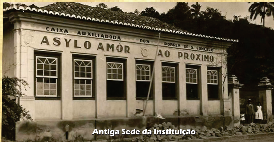
Antiga Sede da Instituição