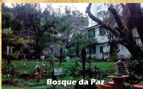
Bosque da Paz