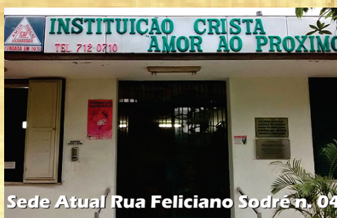
Sede Atual Rua Feliciano Sodré n. 04